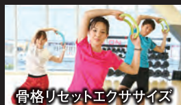
骨格リセットエクササイズ