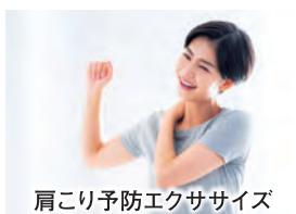
肩こり予防エクササイズ