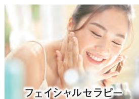
フェイシャルセラピー